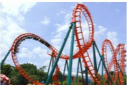
เครื่องเล่นในสวนสนุก