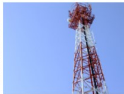
เสาส่งสัญญาณอินเตอร์เน็ต