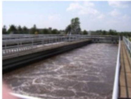
บ่อบำบัดน้ำเสีย