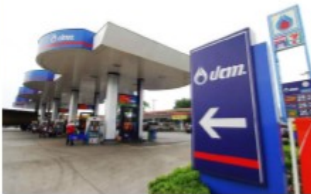
สถานีบริการน้ำมัน