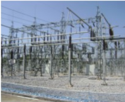
สถานโกไฟฟ้า