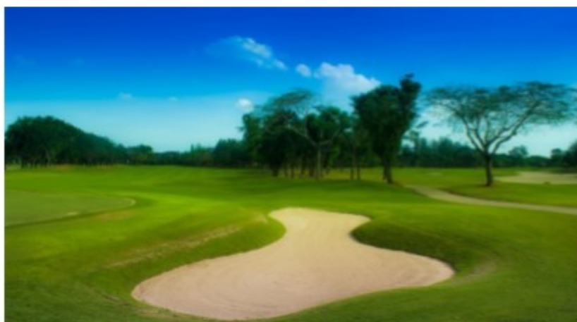
สนามกอล์ฟ จัดเป็นธุรกิจการกีฬา จึงได้รับการลดภาษี

1.4 ลดภาษีร้อยละ 90 ของจำนวนภาษีที่จะต้องเสียของทรัพย์สินที่ใช้เป็นสถานที่เล่นกีฬา สวนสัตว์ สวนสนุก หรือที่จอดรถสาธารณะ