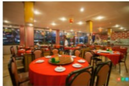
ภัตตาคาร