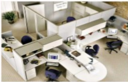
สำนักงาน