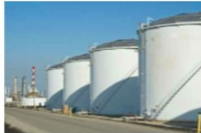
ถังเก็บน้ำมันบนดิน