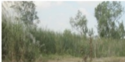
ที่ดินรกร้างไม่ได้ใช้ประโยชน์

(2) ที่ดินที่ไม่เป็นกรรมสิทธิ์ของบุคคลธรรมดาหรือนิติบุคคล แต่อยู่ในความครอบครองของบุคคลธรรมดาหรือนิติบุคคล เช่น สปก. 4, ก.ส.น., ส.ค.1, นค.1, นค.3 ส.ท.ก.1 ก, ส.ท.ก.2 ก, นส.2 (ใบจอง) และที่ดินอันเป็นทรัพย์สินของรัฐ ซึ่งมีการเข้าไปครอบครองหรือทำประโยชน์ ฯลฯ เป็นต้น