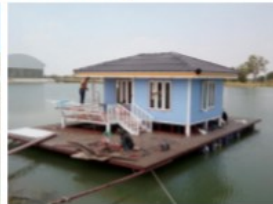
บ้านเรือนแพ