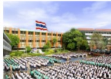
สถานศึกษา