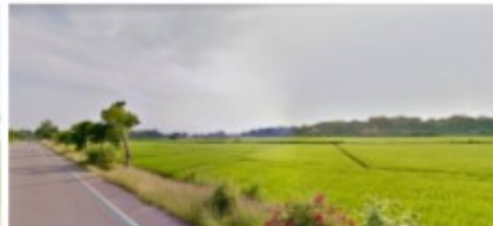
ที่ดินที่ใช้ทำกิจกรรม