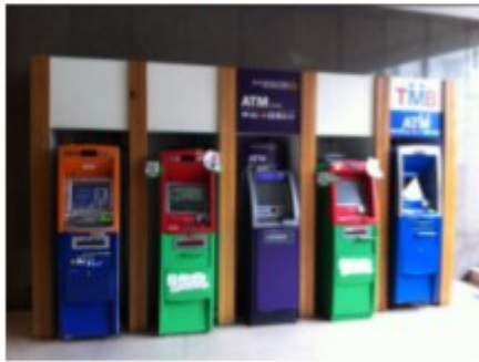
ตู้ฝากถอนเงินสด

ตัวอย่างสิ่งปลูกสร้างที่อยู่ในข่ายได้รับการยกเว้นภาษี