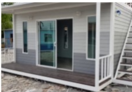
บ้านประกอบเสร็จ