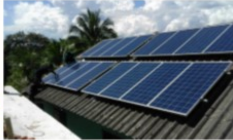
แผงโซลาเซลล์