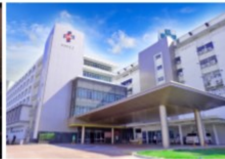
สถานพยาบาล