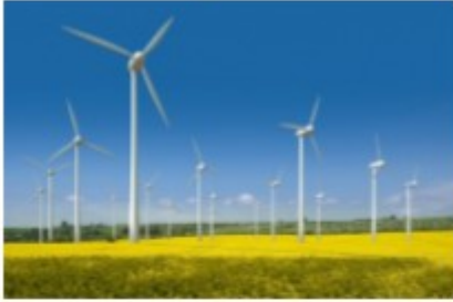
กังหันลม

ตัวอย่างสิ่งปลูกสร้างที่อยู่ในข่ายได้รับการยกเว้นภาษี