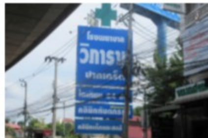
ตัวอย่างป้ายที่ต้องเสียภาษี

หากในกรณีที่ไม่มีผู้มายื่นแบบแสดงรายการภาษีป้าย หรือเจ้าหน้าที่ไม่สามารถติดต่อหรือหาตัวเจ้าของป้ายได้ ให้ถือว่าผู้ครอบครองป้ายมีหน้าที่เสียภาษีป้าย แต่ถ้าหาตัวผู้ครอบครองป้ายไม่ได้ เจ้าของหรือผู้ครอบครองที่ดินที่ติดตั้งป้ายจะต้องเป็นผู้เสียภาษีป้ายแทน ตามลำดับที่กล่าวมา