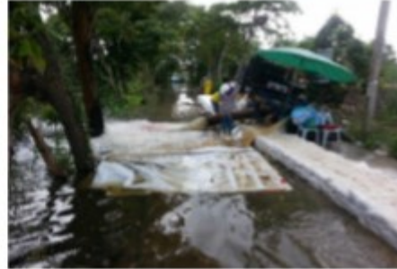
พื้นที่ที่ได้รับภัยพิบัติ จะได้รับการลดหย่อนภาษี

2. ลดหรือยกเว้นภาษีในกรณีที่ดินหรือสิ่งปลูกสร้างได้รับความเสียหายมาก หรือถูกทำลายให้เสื่อมสภาพด้วยเหตุอันพันวิสัยที่จะป้องกันได้โดยทั่วไป โดยมีแนวทาง ดังนี้