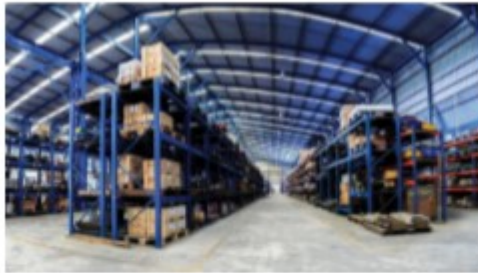
คลังสินค้า