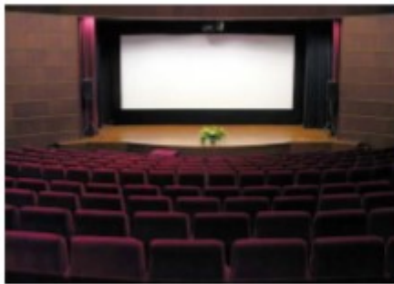
โรงมหรสพ