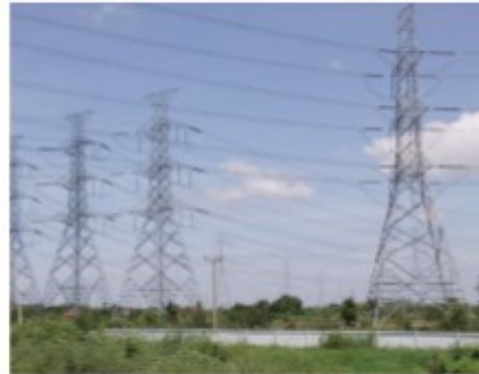
เสาไฟฟ้า