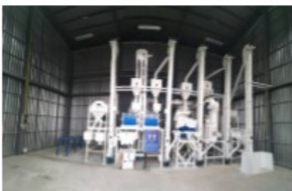
โรงสีข้าว