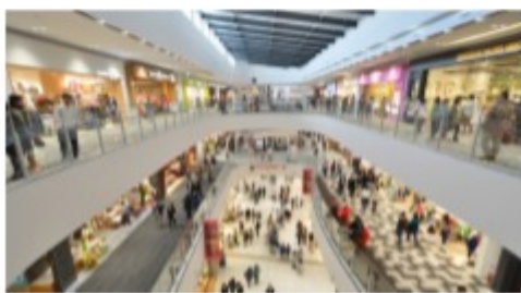
ห้างสรรพสินค้า