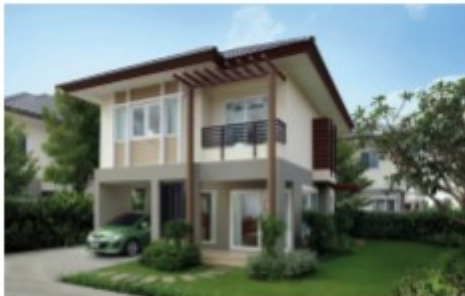
บ้านเดี่ยว