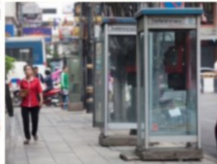
ตู้โทรศัพท์สาธารณะ