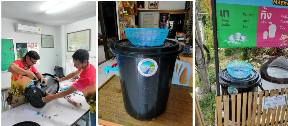
จัดทำถังดักไขมัน