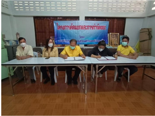
๑. จัดทำบันทึกข้อตกลงร่วมในการจัดการขยะในชุมชน