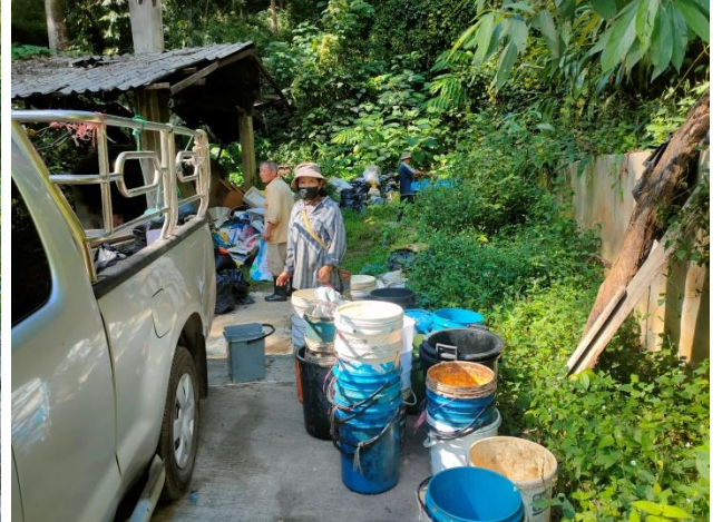
การจัดการขยะเปียกของหมู่บ้านแม่กำปอง