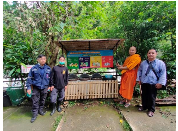
จุดคัดแยกขยะวัดแม่กำปอง