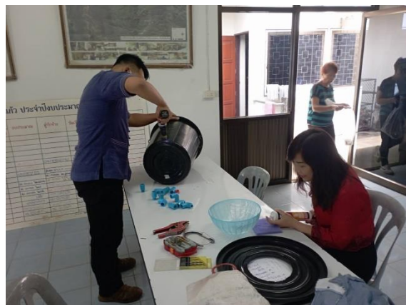
ถังดักไขมันสำหรับทิ้งน้ำ และน้ำแข็ง