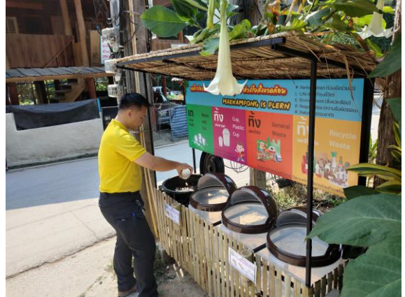
จุดคัดแยกบริเวณลานจอดรถ ณ โรงเรียนบ้านแม่กำปอง