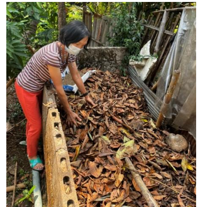
การจัดการขยะเปียกของชุมชน